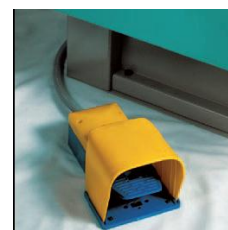
Bild 3 Tillbehör, fotpedal